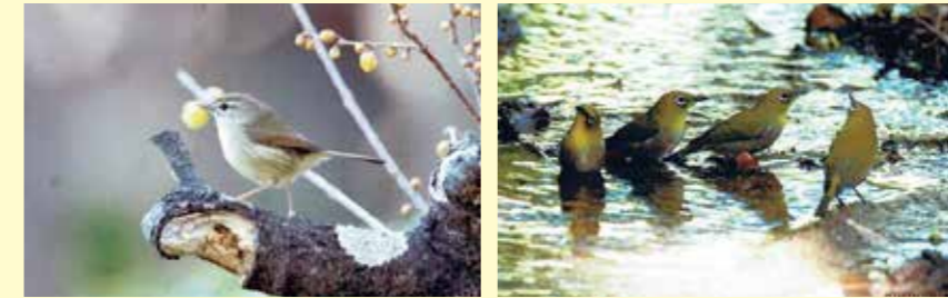
撮影場所: 秋葉公園

エコきちに隣接して、たくさんの木に囲まれた自然豊かな公園。小鳥のさえずりも聞こえ、森林浴も楽しむことができます。また、渡りの小鳥やその他の野鳥がたくさん来ます。冬鳥で有名なツグミやシロハラ、アトリなども見られます。写真は左がウグイス、右がメジロです。ウグイスは冬にも秋葉公園で見られるのです。ぜひ色々な鳥を探しに来てください。